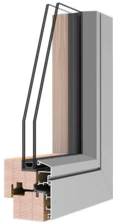
REQUADRO LINE U_w 1.2