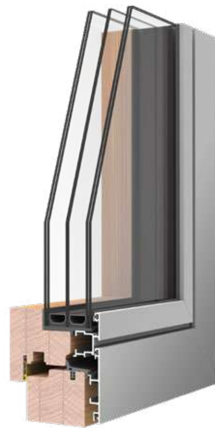
REQUADRO HPF U_w 0.8 ANTA ESTERNA COMPLANARE