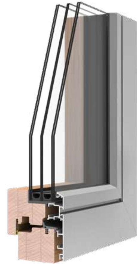
REQUADRO HPC U_w 0.8 CON TRIPLO VETRO